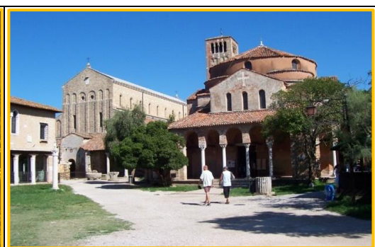
Catedral i església de S. Fosca, on es guarda el seu crani.