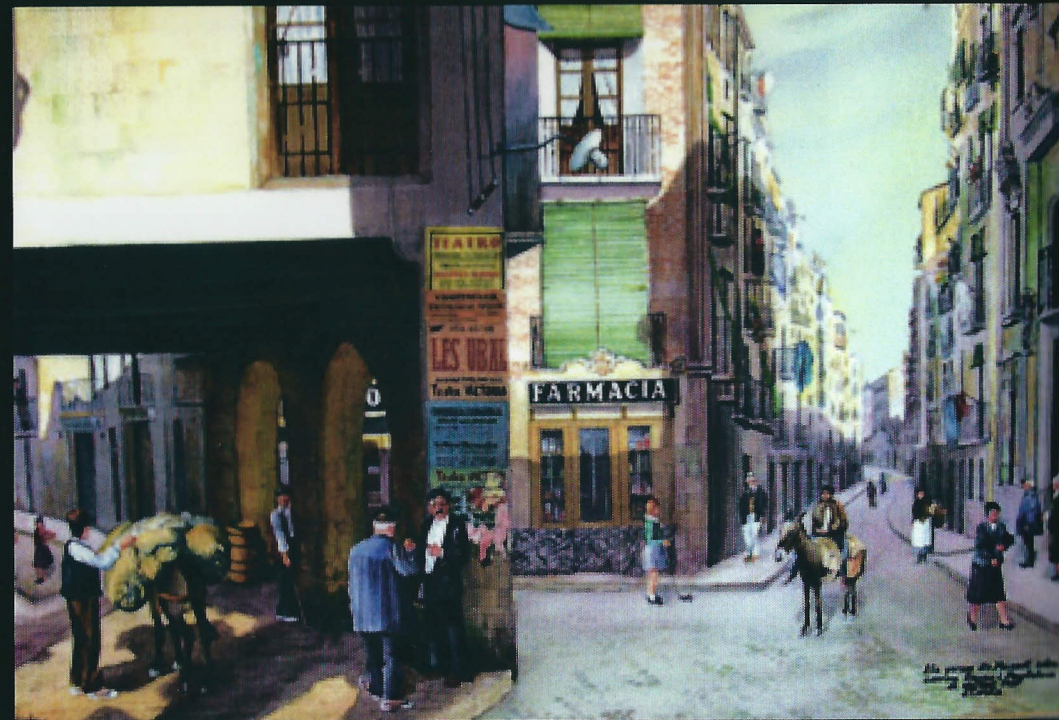
ELS PORXOS DEL MASOT (Lleida, 1920).. Aquarel.la 65 x 97 cm.