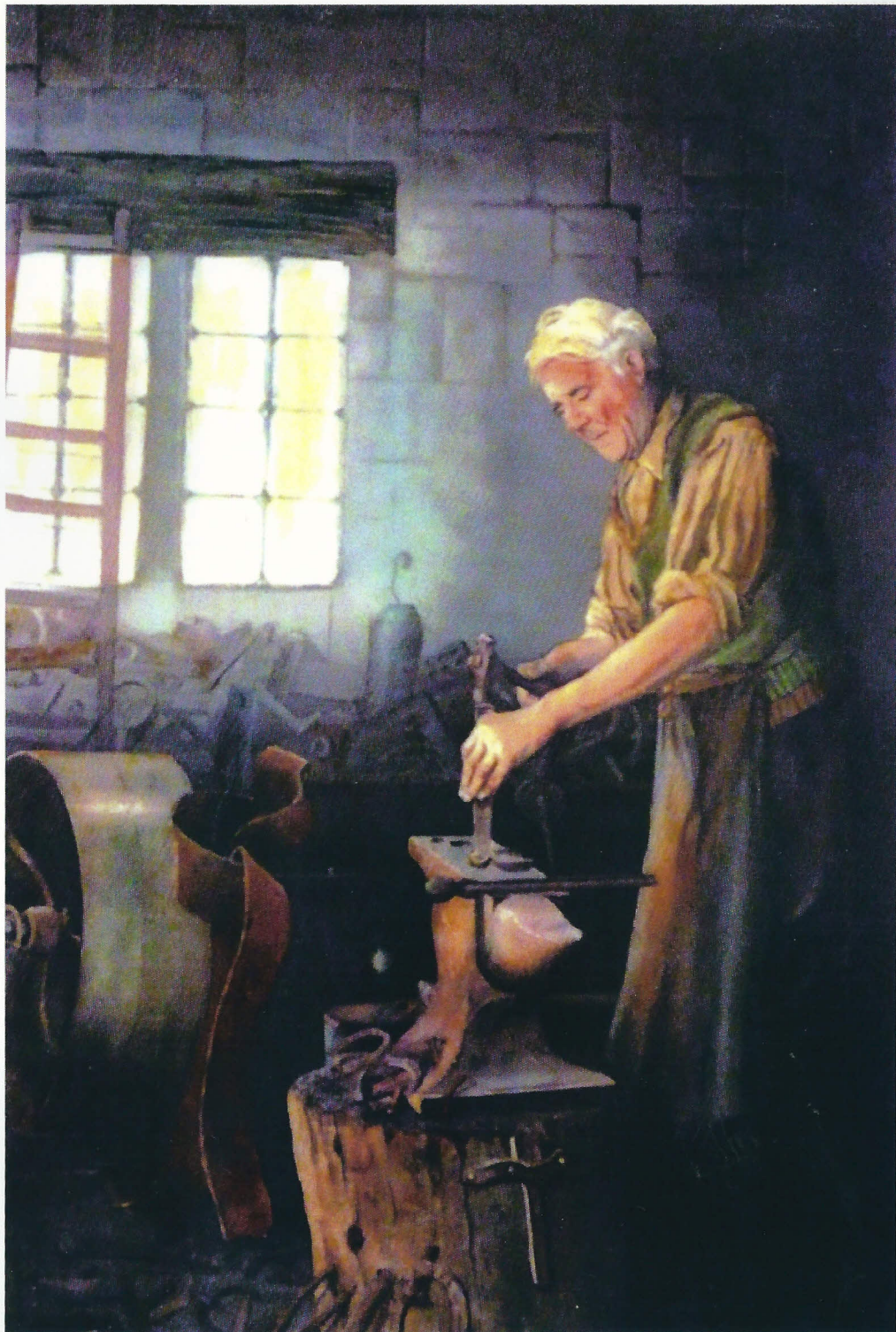
EL FARRE. Aquarel.la 60 x 40 cm.