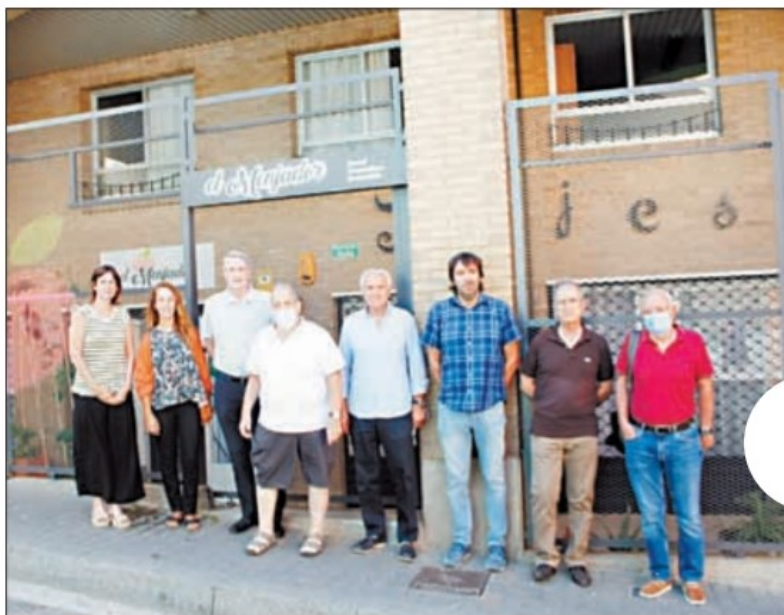
Representants de la Fundació Jericó i del Banc dels Aliments davant del Menjador

El president del Banc dels Aliments de Lleida, Antoni Fo, va dir que "el projecte neix amb vocació de no ser exclusivament un servei d'assistència alimentària, sinó que vol ser un referent en integració comunitària, cohesió social i sostenibilitat mediambiental". Per això, el servei s'ha professionalitzat i comptarà amb una cuinera i una integradora social, que farà el seguiment proper als usuaris, per tal de detectar les necessitats de les persones vulnerables o sense sostre. Així, s'establiran plans de treball conjuntament amb els Serveis Socials de la Paeria i d'altres entitats lleidatanes, que serviran per millorar-ne