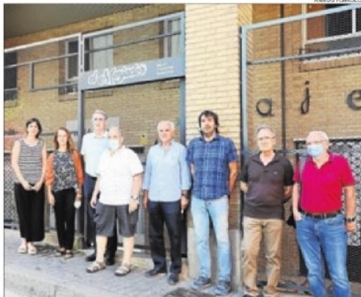
Membres de Jericó i Banc dels Aliments a la façana del menjador.