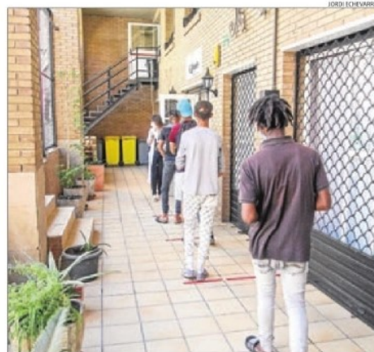
Abans d'entrar es pren la temperatura dels usuaris.