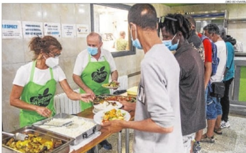
Els primers comensals reben el seu menjar el primer dia d'obertura del menjador social.