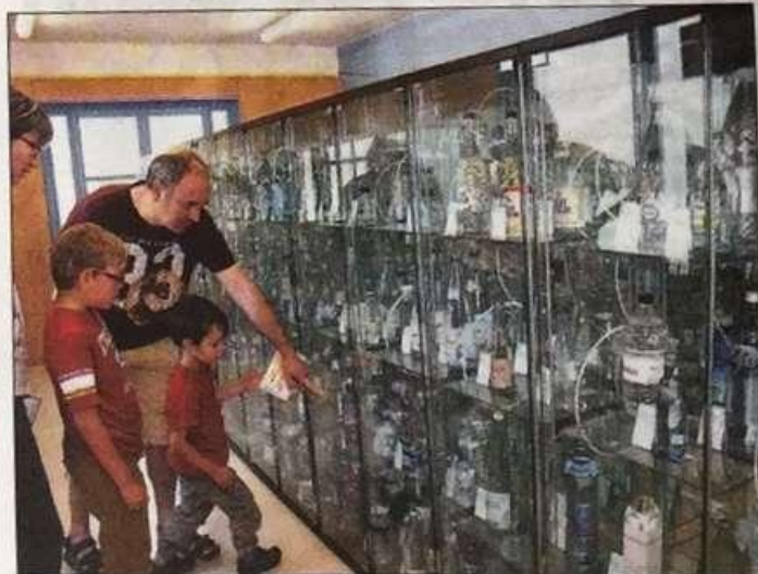
Todas las botellas están expuestas en el Museu de l'Aigua