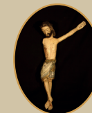
JORNADAS MARTIRIALES DE BARBASTRO