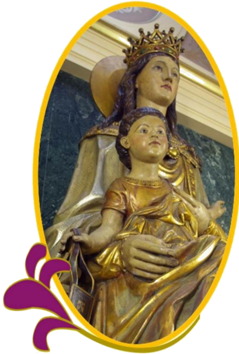
Mare de Déu del Carme Lleida