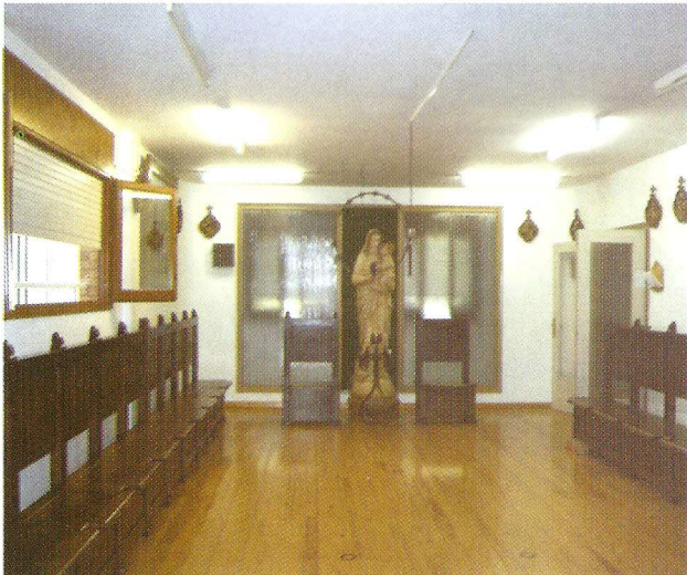
COR DEL MONESTIR

El nostre monestir es troba al bell mig de l'horta, en un turó des del qual es domina tota la ciutat, envoltat d'una esplèndida natura i d'un silenci absolut.