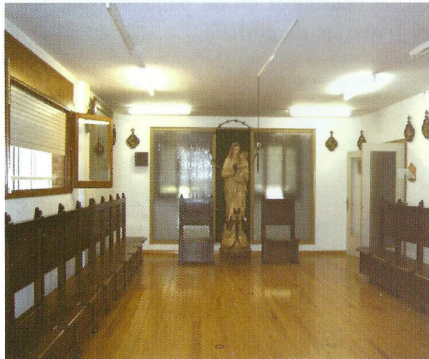
CORO DEL MONASTERIO

Está rodeado de espléndida naturaleza y de silencio.