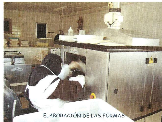
ELABORACIÓN DE LAS FORMAS

Vivimos una vida sencilla y austera... Las horas que no dedicamos a la oración, las dedicamos a los diversos trabajos con los que procuramos nuestro sustento. Nuestras ocupaciones principales son la elaboración de formas para la Eucaristía, la restauración de pequeñas imágenes y trabajos de pintura.