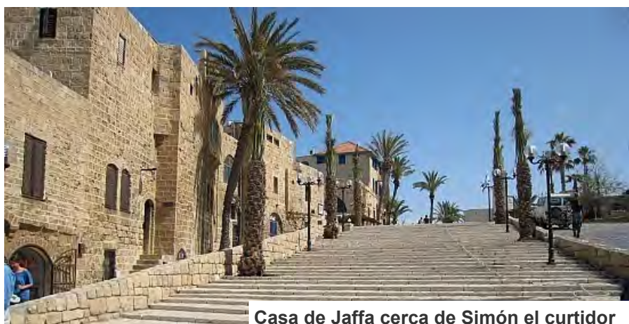
Casa de Jaffa cerca de Simón el curtidor