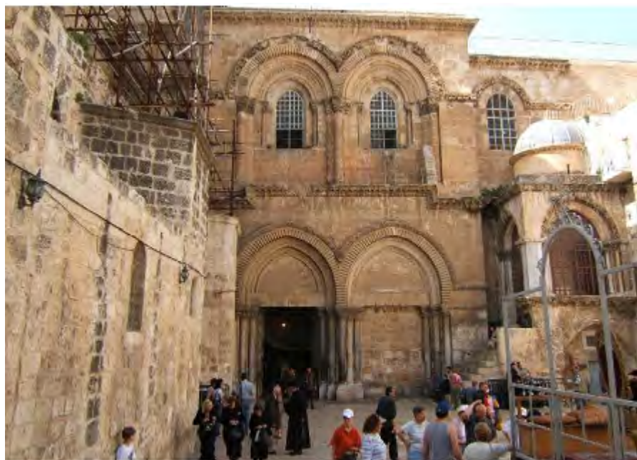
Església del Sant Sepulcre