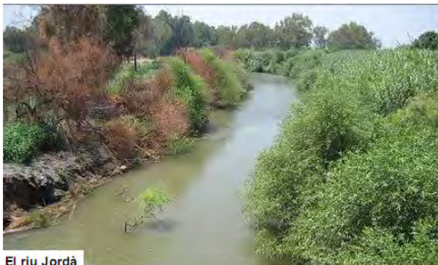
El riu Jordà