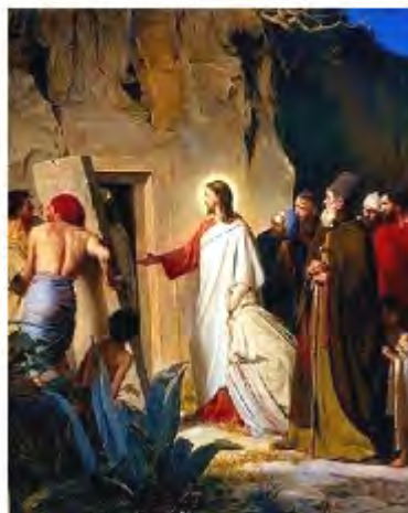
Escena de la resurrecció de Llàtzer