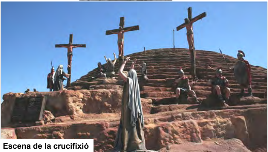
Escena de la crucifixió