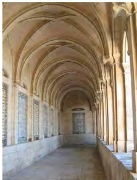
Galeria del Pater noster