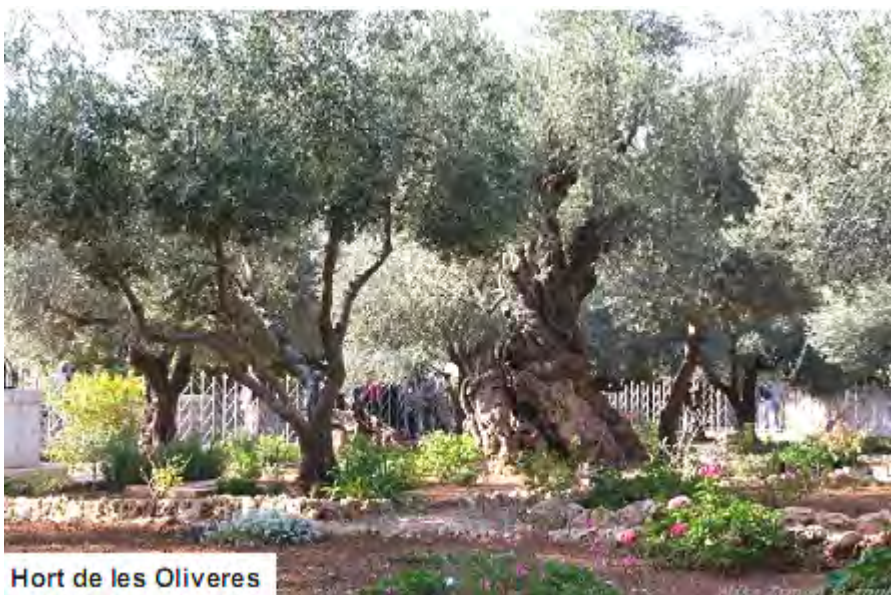
Hort de les Oliveres