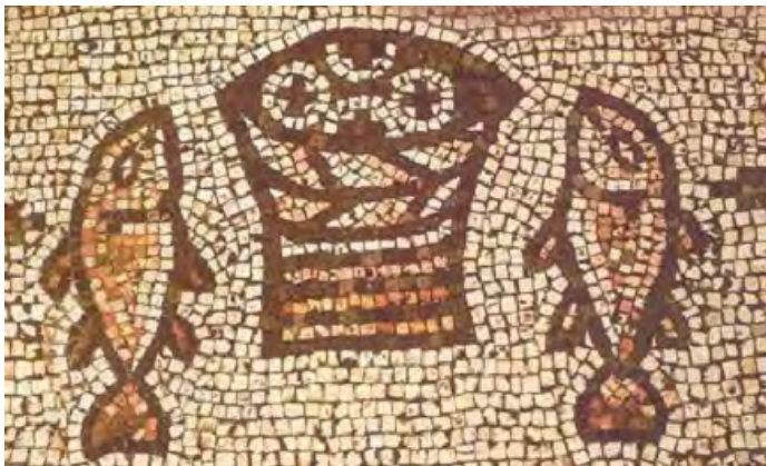
Tabga. Multiplicació dels pans i els peixos