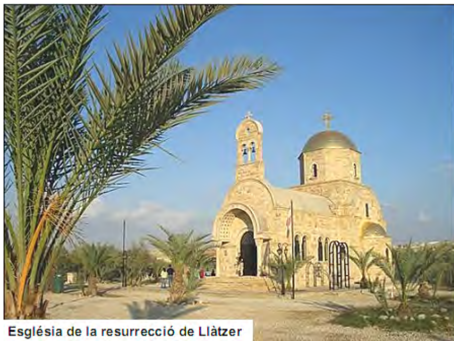
Església de la resurrecció de Llàtzer