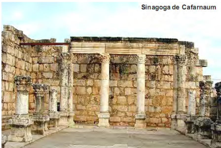
Sinagoga de Cafarnaum