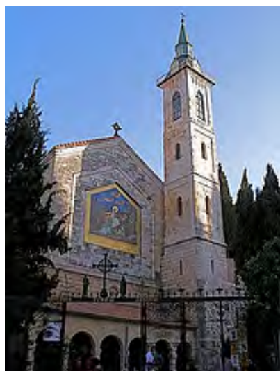
Església de la Visitació