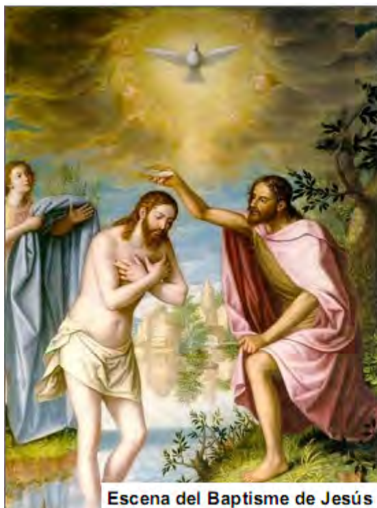
Escena del Baptisme de Jesús