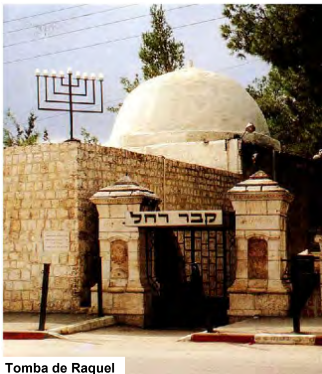
Tomba de Raquel