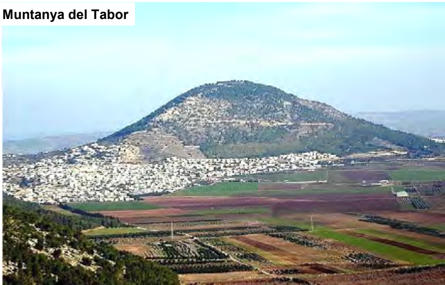
Muntanya del Tabor

8 Ells van alçar els ulls i no veieren ningú més que Jesús tot sol.