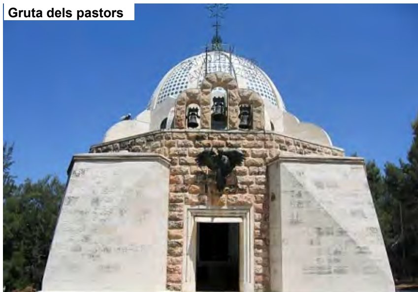
Gruta dels pastors