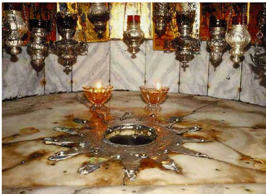
L'estrella indica el lloc on va néixer Jesús