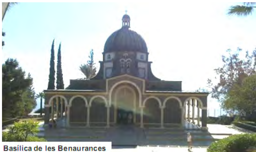
Basilica de les Benaurances