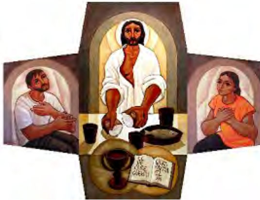
Escena dels deixebles d'Emmaús. Retaule de la parròquia Sant Antoni Maria Claret, de Lleida