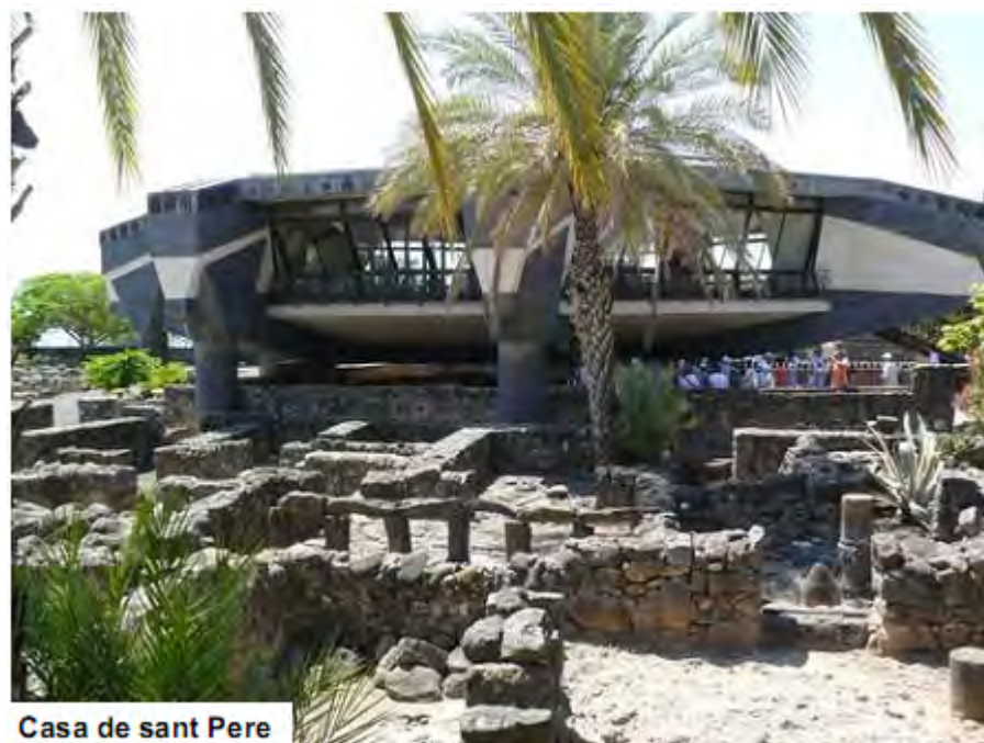
Casa de sant Pere