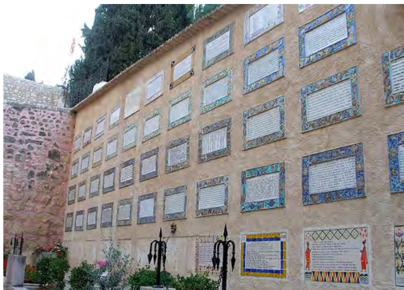
Plaques del Magníficat a l'església de la Visitació