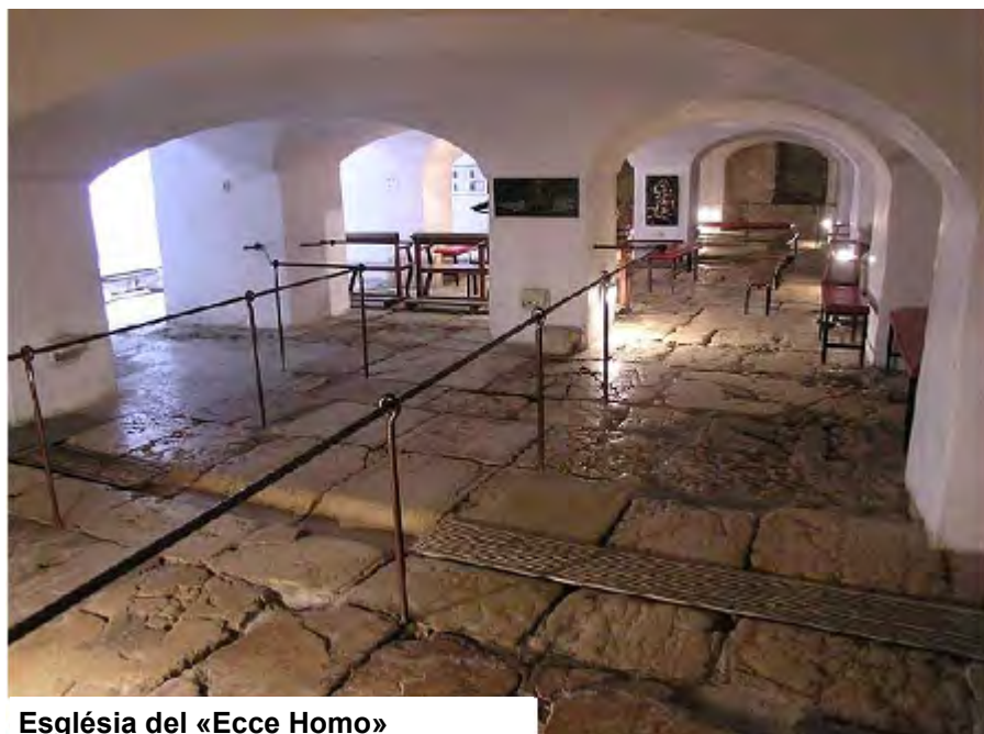
Església del «Ecce Homo»