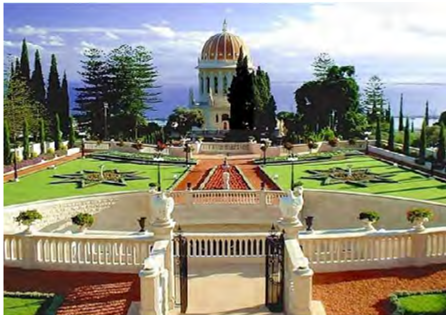
Monestir Carmelita de Stella Maris, Jardins Perses i temple Bahai.