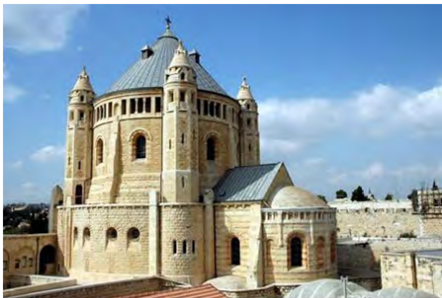
Basílica de la Dormició de Maria