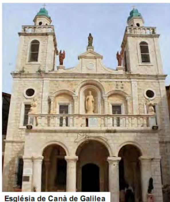
Església de Canà de Galilea