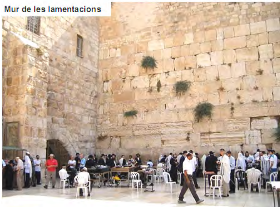
Mur de les lamentacions