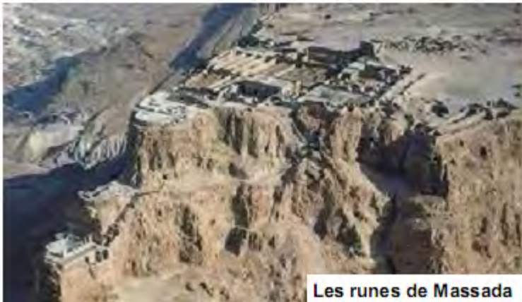
Les runes de Massada

--Tu ets el meu Fill, el meu estimat; en tu m'he complagut.