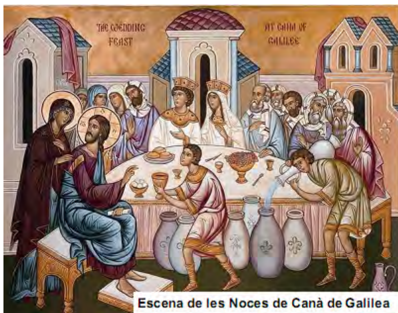
Escena de les Noces de Canà de Galilea