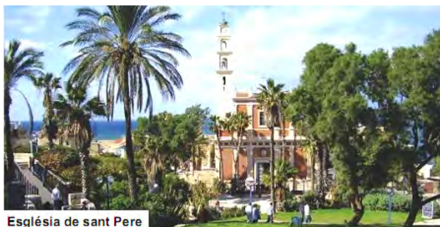
Església de sant Pere