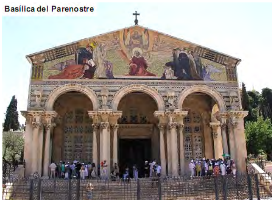
Basilica del Parenostre