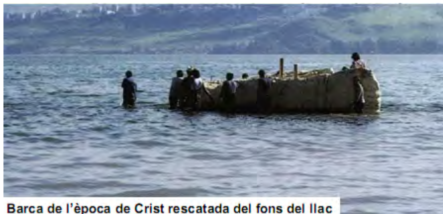
Barca de l'època de Crist rescatada del fons del llac