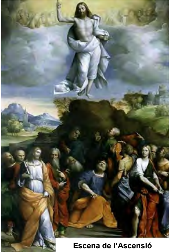
Escena de l'Ascensió