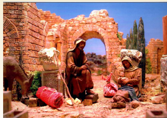
Diorama del Mestre Pessebrista Josep M. Ramon