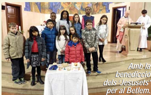
Amb la benedicció dels 'Jesusets' per al Betlem.