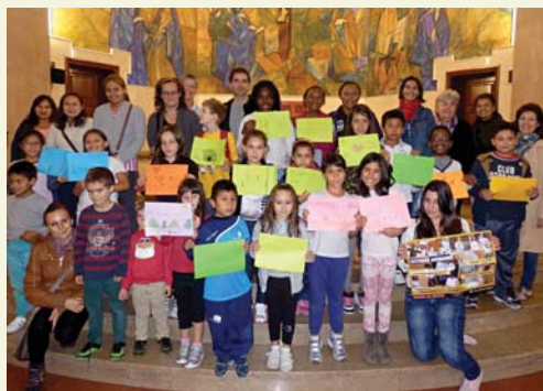
Reixeix l'alegria del DOMUND: «josócdomund».