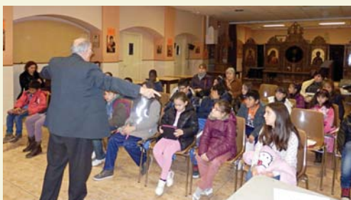
Catequesi sobre la Infància Missionera. Un nen missioner coneix i estima Jesús, parla amb Jesús (resa) i la seva mare Maria, sap que tots els nens són germans de Jesús, ho comparteix tot amb els altres nens i sempre està content.