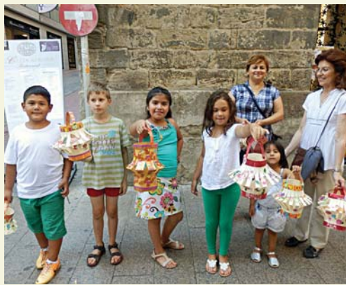
Placa de la Diputació al millor conjunt de fanalets de Sant Jaume.