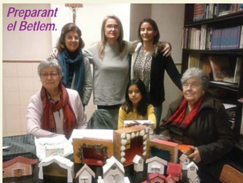
Preparant el Betlem.