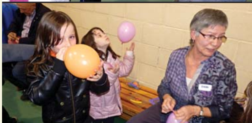
Fira de la Infància Missionera al Col·legi de la Sagrada Família amb els nens, pares i catequistes de parròquies i esplais cristians de la diòcesi. Jocs, formació, convivència i el testimoni missioner de Montserrat, Germaneta dels Pobres.