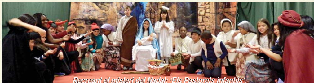
Recreant el misteri del Nadal: 'Els Pastorets infantils'.