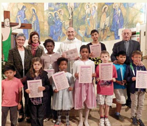
Catequesi Quaresmal i Baptismal. Els nens i nenes que es preparen per la Primera Comunió han rebut solemnement les làmines on es condensen els principis fonamentals de la doctrina cristiana.