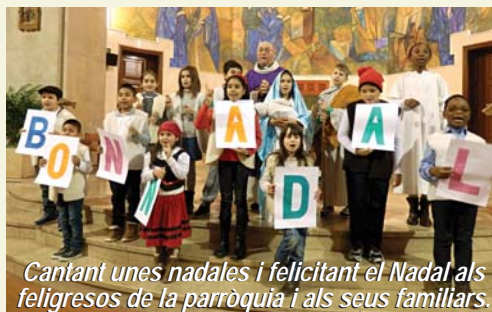
Cantant unes nades i felicitant el Nadal als feligresos de la parròquia i als seus familiars.