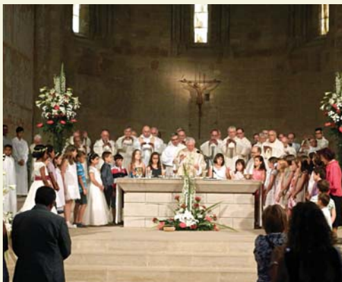
Missa i processó eucarística a la Seu Vella. Els arxiprests han imposat una creu als nens, "un signe de Jesús que us estima sempre".