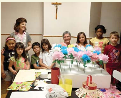
Tallers de fanalets i de flors.