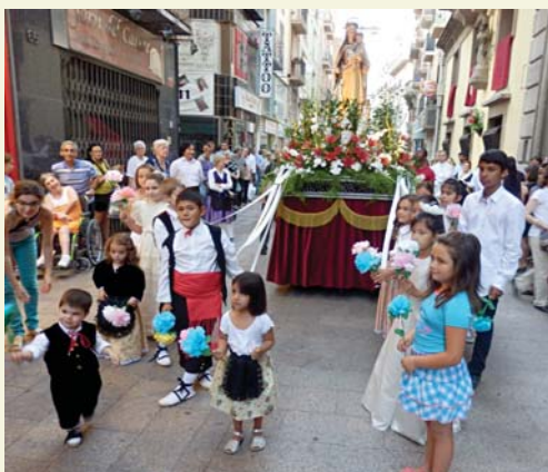
Processó de la Mare de Déu del Carme.