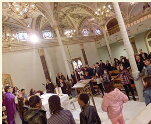
Trobada arxiprestal d'Advent. La pel·lícula «En busca del medallón perdido» i l'Eucaristia han estat l'ocasió per fer el camí de l'Advent més units i viure amb més intensitat les festes de Nadal.