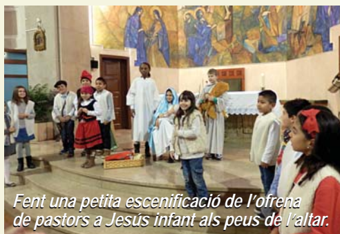
Fent una petita escenificació de l'ofrena de pastors a Jesús infant als peus de l'altar.