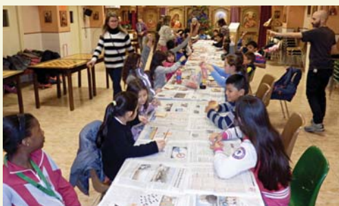
Premi dels Pessebristes al grup de Catequesi.