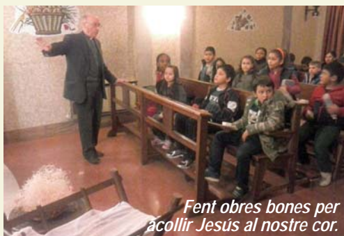
Fent obres bones per acollir Jesús al nostre cor.