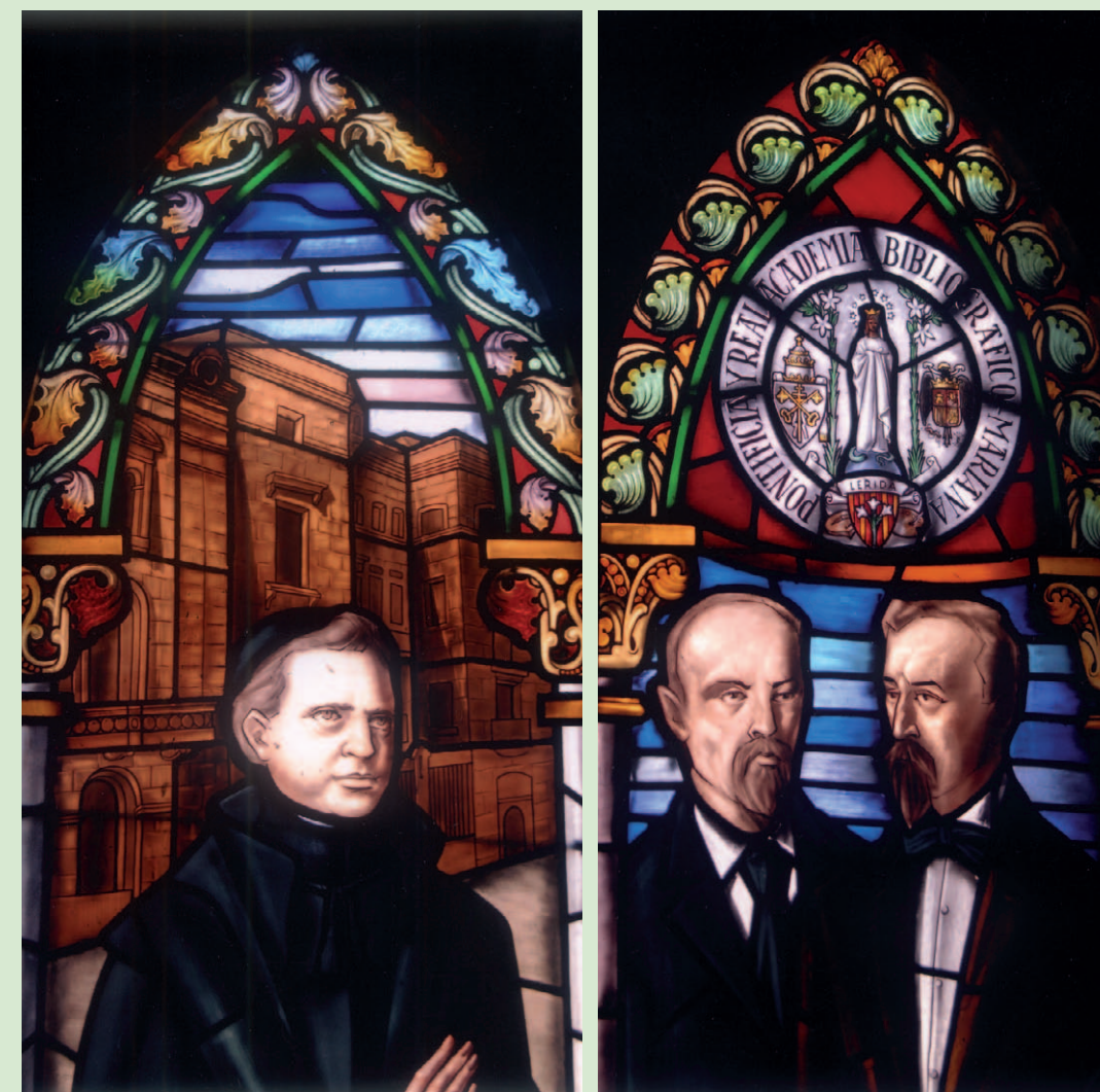
MOSSÈN JOSEP ESCOLÀ I CUGAT La Fatarella 1820 – Lleida 1884

LLUIS ROCA I FLOREJACHS I JOSEP MENSA I FONT COFUNDADORS