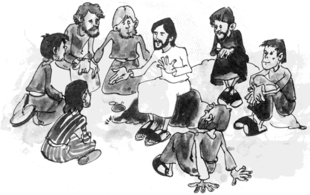
Jesús ho explicava als apòstols