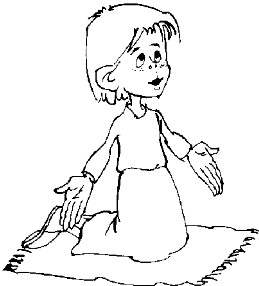
I, agraïts, preguem així, com ens ensenyà Jesús

Pare nostre, que esteu en el cel: Sigui santificat el vostre nom. Vingui a nosaltres el vostre regne. Faci's la vostra voluntat així a la terra com es fa en el cel.