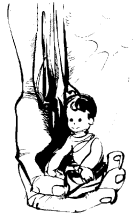
Déu ens protegeix