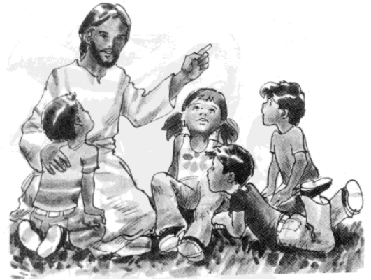
I ho explicava als nens