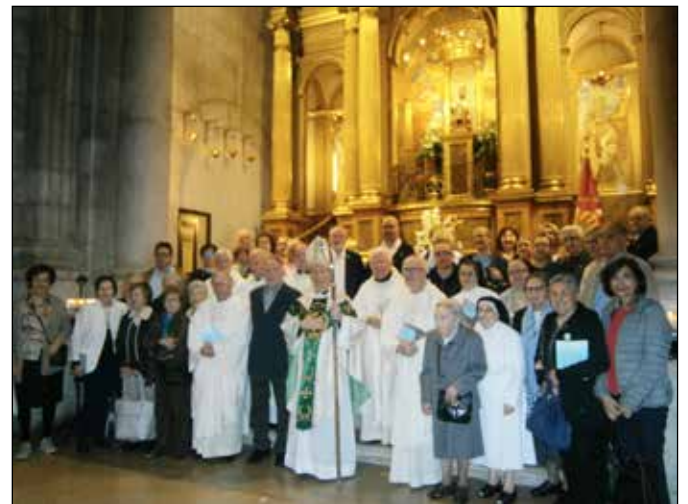
Foto de grup, davant la Capella dels participants a la Trobada.

Per cloure i abans de cantar el Virolai i pujar al cambri a venerar "la Moreneta", la Confraria feu lliurament com a record d'un exemplar del llibre "La Confraria