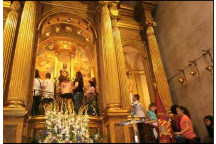
La filera de fidels pujant al Cambril va ser una constant.