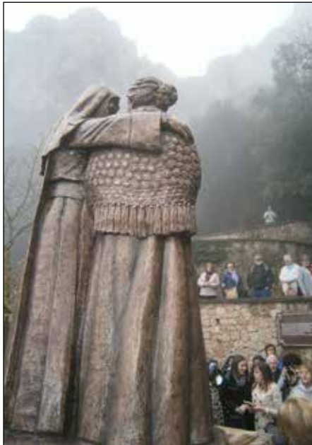
Estàtua de Sta. Teresa Jornet i l'anciana, al camí de St. Miquel de Montserrat.

Els cristians estem vivint uns reptes molt forts i un d'ells és la globalització , present en tots els nivells de la societat.