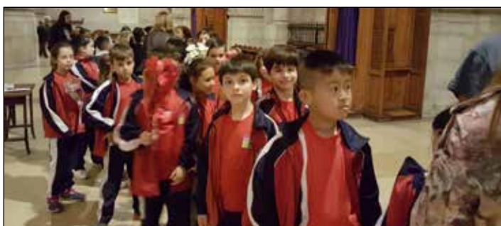
Els infants van protagonitzar l'ofrena de flors el matí de la Festa.

Durant bona part del matí els protagonistes van ser els grups d'alumnes de diversos centres escolars de la ciutat, com els del col·legi Santa Anna i Pràctiques I, que acudiren a la Catedral amb flors i pujaren, amb certa emoció infantil, a venerar “la Moreneta” i recollir un punt de llibre dels 5.000 que havia editat la Confraria com a record de la diada. A mitja tarda, la cua de fidels que aguardaven per pujar al cambril de la Verge, donava tota la volta pel darrera de l'altar major de la Catedral, alhora que la reixa de la capella s'anava omplint de les ofrenes de flors i ciris a la Patrona.