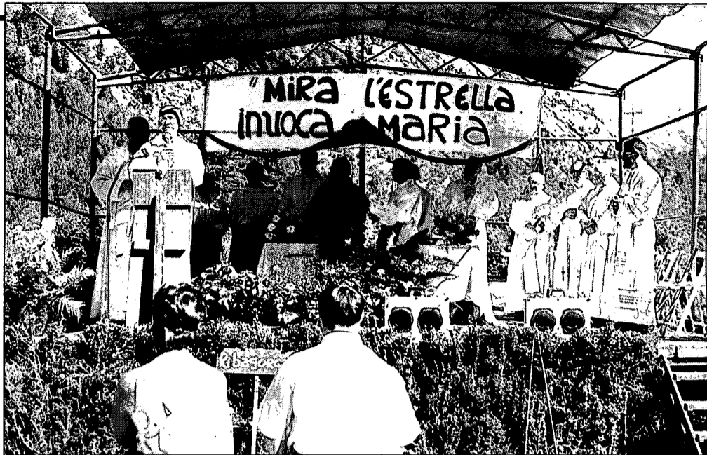
El lema «Mira l'estrella, invoca Maria», va presidir l'altar de l'Eucaristia.

Mn. Mora recordava com fa 22 anys que la trobada va sorgir per poder aplegar almenys un dia a l'any la gent de tres comarques naturals que conformen la Ribagorça, de Benavarri fins a Castiellonroy, la comarca de l'Areny i l'Alta