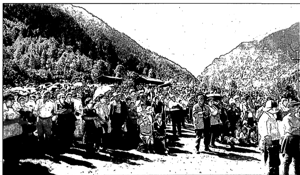
Els nombrosos pelegrins omplien el prat de Toirigo.

Ribagorça catalanoaragonesa: «Va ser l'any 1979 en què el poble de Sopeira ens va congregar per primera vegada, enguany ha estat Boí i l'any vinent Aler, un poblet