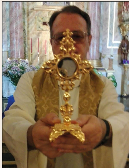
La relíquia de la Parròquia del Patriarca S. José