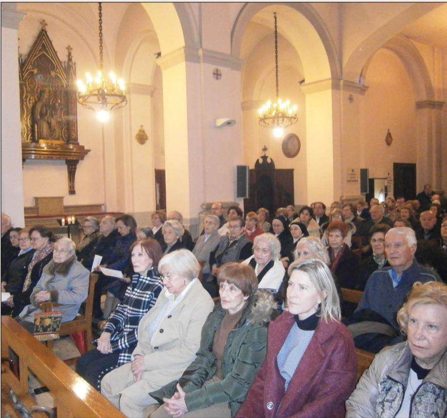
Un bon nombre de fidels van omplir l'església de Sant Pere de Lleida en la Celebració.